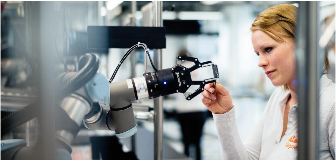
Mensch-Roboter-Interaktion: Die Smartphone-Fertigung bei Gigaset in Bocholt